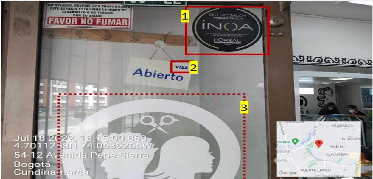
Fotografía No. 4

En la que se puede evidenciar: tres (3) elementos publicitarios incorporados en la puerta del establecimiento comercial identificados con los números 1, 2, y 3.