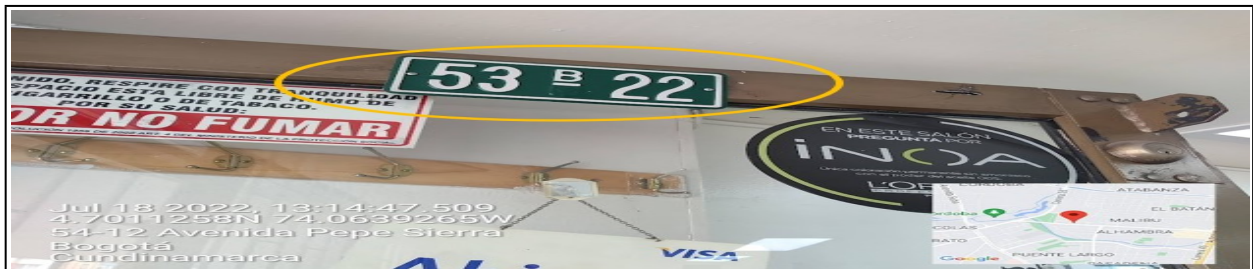
Nomenclatura del predio en el que se sitúa el establecimiento comercial denominado PELUQUERÍA ALHAMBRA ubicado en la CL 116 No. 53 B – 22 .