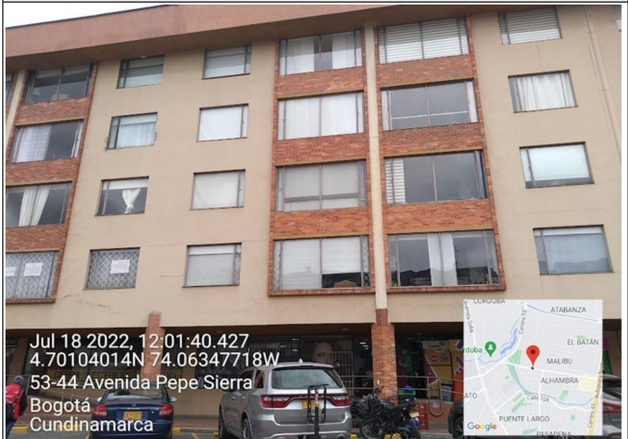
Vista panorámica del predio donde se sitúa el establecimiento comercial denominado PELUQUERÍA ALHAMBRA .